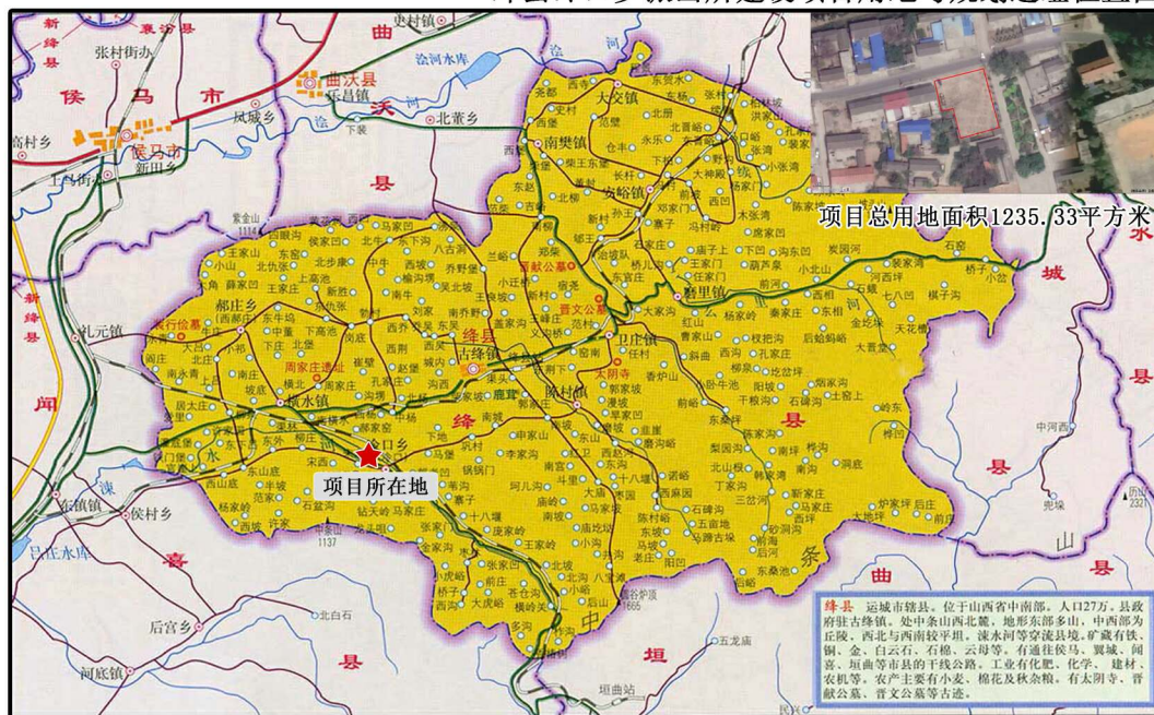
绛县冷口乡派出所建设项目用地与规划选址位置图